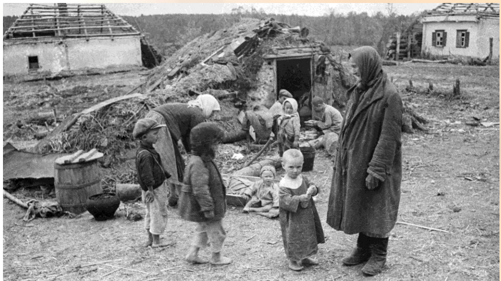
Оккупированная территория Белоруссии