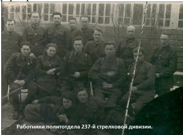
Работники политотдела 237-й стрелковой дивизии.